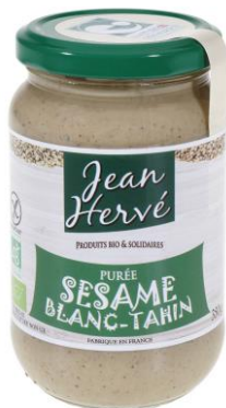
3390390001730 Pots verre 0,35kg