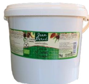
3390390001853 Seau plastique 5kg