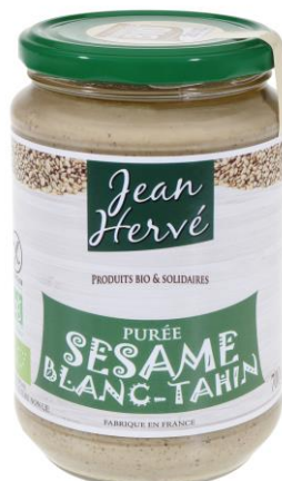
3390390001747 Pots verre 0,7kg